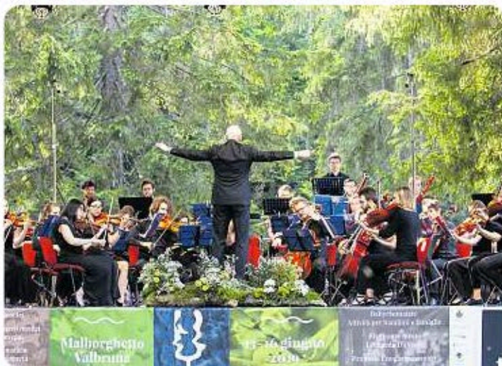
Im Saisera-Tal, im Wald der Resonanzbäume, geht alljährlich ein viel beachtetes Musikfestival über die Bühne